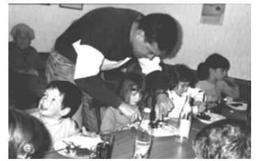
Den ganz Kleinen wird das Essen noch geschnitten