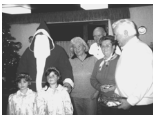
Nikolaus mit Jubilare

Die Tombola hatte dieses Jahr einen besonderen Leckerbissen: Es gab eine Verlosung speziell für Kinder bei der es ausschließlich Spielsachen zu gewinnen gab. Alles in allem ein gelungener Nachmittag für die kleinen und großen Gäste. RD