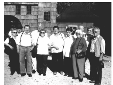
Am Eingang zum Märchenwald