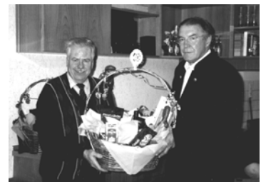
Ehrung beim QRT