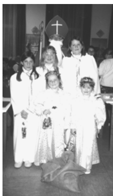
Der Nikolaus mit seinen Engeln

Informationen zu Anmeldungen und Kartenvorverkauf finden Sie auf Seite 4.