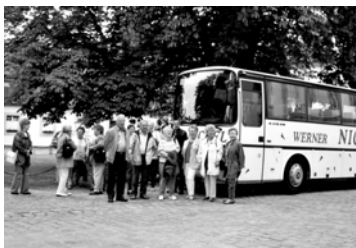
Ein Teil der Gruppe mit Bus

Die Busfahrt ging zuerst nach Ellingen, dort wurde eine Führung im Schloss angeboten, fast alle nahmen daran teil. Der Rest machte selbst einen kleinen Rundgang (vom Bus zur Schlosswirtschaft auf ein gutes Bier). Die Führung dauerte eine Stunde.