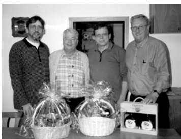
Unser 1. Vorstand bei der Siegerehrung

Unser Schafkopfrennen in Mimberg ist ja schon traditionell. Und es war wieder richtig spannend. Zu Beginn wurde geunkelt, daß vielleicht gar keiner mehr Schafkopfen kann, doch es wurden tatsächlich 4 Tische und fast wären es fünf geworden, wenn noch 1 Mann gekommen wäre. Aber es wurde auch so für die Nichtkartler ein schöner Nachmittag bei Kaffee und Kuchen. Tja, und dann wurde einer aufgespielt. Es hallte nur so von Rufen wie „Wenz“ oder „I spiel a Solo“. Es wurden auch „Spritzen“ gegeben. So ist das halt beim Schafkopfen, aber einen „Tout“ oder einen „Sie“ hat diesmal keiner geschafft.