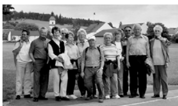
Die fröhlichen Wanderer