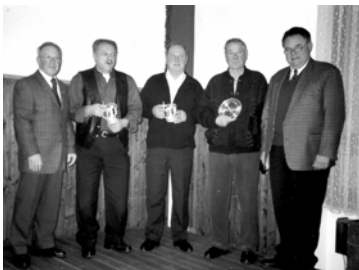
Jubilarehrung der Abt. 9

Unsere Jahreshauptversammlung fand am 7.3.2003 im Sportheim in Reichelsdorf statt. Nur 32 Mitglieder hatten sich eingefunden. Auch von den 5 Jubilaren (zwei 25-jährige und drei 40-jährige) kamen nur 3 zur Ehrung von der Abt. 9. Bei den Neuwahlen der Vorstandschaft hat sich nichts geändert. Wiedergewählt wurden: