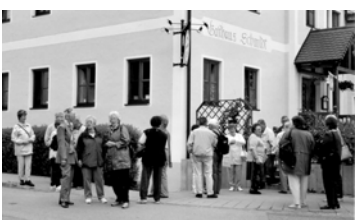
Vor dem Gasthaus Schmidt