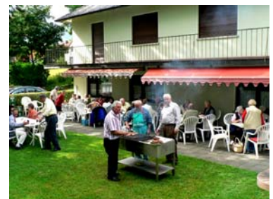
Die Terrasse von unserem Sportheim