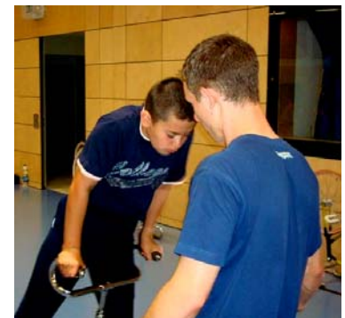
Unsere Sportler bei Übungen, die zum Muskelkater führen