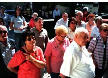
Einige der Teilnehmer

Am Sonntag, dem 20. Mai war eine Fahrt ins Blaue angesagt. Es hatten sich 46 Teilnehmer eingeschrieben. Um 9 Uhr war Start vom Sportheim des SV Reichelsdorf. Nachdem die Fahrt in Richtung Steigerwald bekannt war, konnten einige Teilnehmer auf dieser Strecke zusteigen.