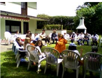
Kindergarten Tafelfeldstraße Nürnberg

Unser Vereinsjugendheim in Mimberg, das wir ja regelmäßig an verschiedenen Gruppen und Vereinen vermieten, wird seit zwei Jahren sehr viel von Schulklassen, Kinderhorten und Kindergärten genutzt. Als Erholungs- und Schulungszentrum ist es bei diesen Gruppen, die zum größten Teil aus Franken kommen, sehr beliebt. So konnten wir bei uns heuer schon die Kinder und Betreuer zweier Kindergärten, zwei Kinderhorte und eine Schulklasse begrüßen. Dabei waren auch Stammgäste, die unser Haus schon des öfteren gebucht hatten. Auch kirchliche Gruppen sind bei uns sehr oft zu Gast, die ihre Konfirmandenfreizeiten und andere Aktivitäten in Mimberg durchführen.