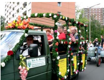
Die „Besetzung“ des Kärwa- wagens