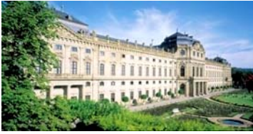
Die Residenz in Würzburg