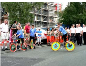
Aufführung am Heilbronner Platz