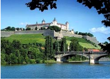
Die Festung Marienberg