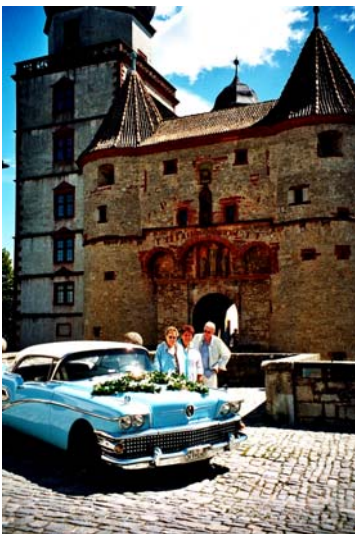
Tolle Stadt, super Auto, gut ge- launte Mitglieder