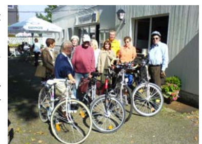
Die Radler der Abt. 5