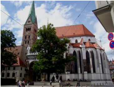
Der Dom zu Augsburg

Am Mittwoch den 12.12.2007 hatten wir unsere letzte Zugfahrt mit dem Bayerticket für 2007 - es ging nach Augsburg.