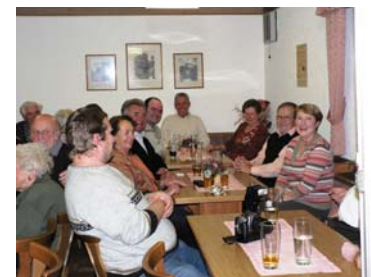
Beste Stimmung beim QRT