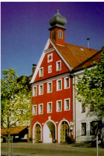
Das Rathaus von Ortenburg