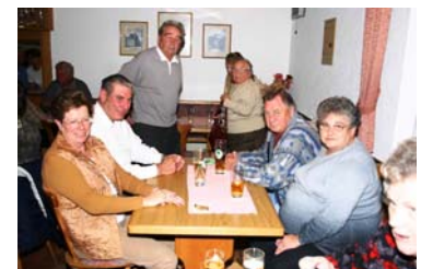
Drinnen war es dann doch gemütlicher...