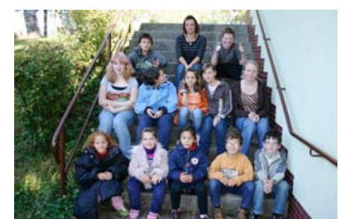
Oben: Die Teilnehmer Unten: Beim Laternenbasteln