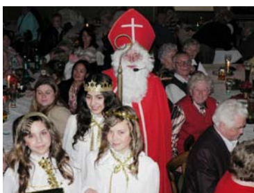
Der Nikolaus kommt