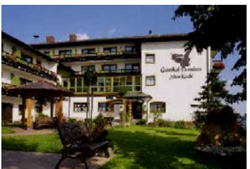
Das Hotel „Zum Koch“

Vom 30. September bis 02. Oktober 2007 war unsere Herbstfahrt nach Ortenburg in Niederbayern. Bei herrlichem Herbstwetter trafen wir uns am Sonntag um 8:00 Uhr an der U-Bahnhaltestelle Rothenburger Straße. Hier stieg ein Teil der Fahrgäste ein, der Rest ging dann in Reichelsdorf an Bord.