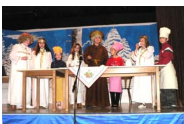
Die Theaterspieler beim Weihnachtsstück