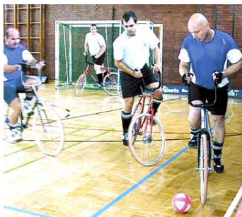
Nürnberg in Blau

Am 20. Sept. 2008 fand in der Schulturnhalle Reichelsdorf Schloßleinsgasse ein Radball-Städteturnier anlässlich des 100-jährigen Vereinsbestehens statt. Die Mannschaften aus Steinwiesen, Bischberg, Gaustadt, Stein und Nürnberg zeigten schöne und spannende Spiele. Gekämpft wurde äußerst fair. Obwohl es verschiedene Ligen gibt, wurde darauf nicht geachtet. Nahezu drei Stunden dauerte der Kräftevergleich bis endlich die Sieger feststanden. Die Siegerehrung wurde im nahen Sportheim des SV Reichelsdorf durchgeführt.