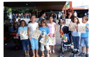
Bei der Siegerehrung