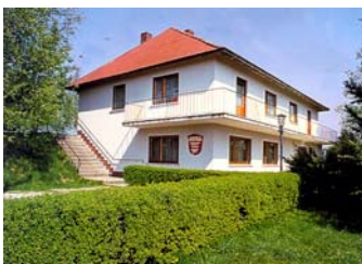
Unser Jugend- und Sportheim in Mimberg

Die Jugendleitung der Solidarität Nürnberg lud vom 22. bis 23. 10.2008 wieder zum traditionellen Bastelwochenende nach Mimberg ein. Wie schon in den vergangenen Jahren werden an diesen Wochenenden kurz vor den Weihnachtsfeiern des Vereins Gegenstände für die Weihnachtszeit gebastelt. Heuer waren es wieder Sterne und Tischschmuck. Bei dieser Wochenendfreizeit wird natürlich nicht nur gearbeitet, sondern es soll auch bei Spiel und Spaß zu einem schönen Erlebnis für die Jugendlichen werden. Dabei sind auch die Helfer nicht zu vergessen, seien es die Jugendleiterinnen und Leiter sowie das Personal, das für das leibliche Wohl sorgt. Dafür vielen Dank!