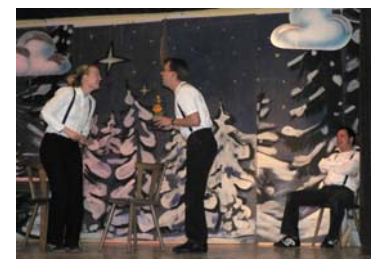
Die Darsteller von Holterdipolter