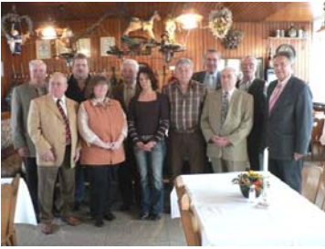
Die neu gewählte Verwaltung des ASV Solidarität