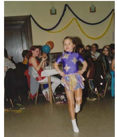
Die Kindergarde beim Kinderfasching der Ortsgruppe