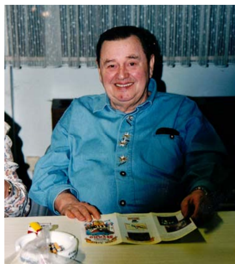
Otto beim Monatstreffen der Abt. 9

In den Wiederaufbaujahren nach dem Krieg selbst aktiv Sportler gewesen, war auch danach der Sport immer sein besonderes Anliegen, den er mit all seiner Tatkraft unterstützt hat, solange er konnte.