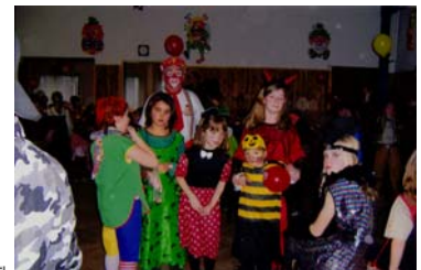
Schöne Masken beim Kinderfaschingsball der Abteilung 9