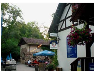
Die Waldschänke „Brückkanal“

Am Samstag, den 9. Mai 2009 trafen sich die Teilnehmer der Abteilung 5 im Biergarten „Zum Brückkanal“. Unsere Runde zählte elf Ausflügler. Mancher hatte vor mit dem Rad'l zu fahren, aber keiner wagte es wegen dem unbeständigen Wetter. Unsere Wanderung begannen wir am Höhenweg der Schwarzach, zurück wollten wir durch