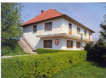
Unser Jugendheim Mimberg

Die erste Hälfte des Jahres 2009 ist nun vergangen und es ist wieder soweit über unser Jugendheim in Mimberg zu berichten. Vom 02.01. bis 28. 06.09 hatten wir in Mimberg 14 Jugendgruppen und Vereine, bei zusammen 48 Belegungstagen, zu Gast. Da die Gruppen meistens Wochenende buchten, in den Ferien natürlich auch Wochentage, waren dies bis jetzt 48 Belegungstage.