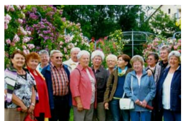
Besuch im Rosengarten