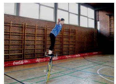
Eine gelungene Kunstradeinlage