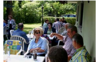
Das Wetter hat mitgespielt

PS: Danke an die Kollegen von cycleballer.de für die schnelle Bereitstellung der Daten im Web,