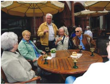
In gemütlicher Runde