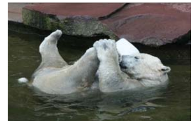
Flocke ist inzwischen auch schon ganz schön groß