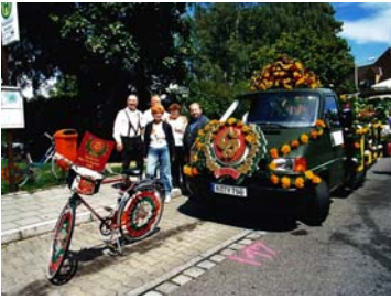
Die festlich geschmückten Fahrzeuge