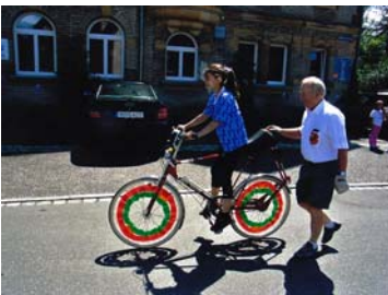
Auf dem Spezialrad

Am 25. Juli hatten wir den 26. Kirchweihzug in Reichelsdorf. Auch die Solidarität Nürnberg Abteilung 9 Reichelsdorf war wieder mit dabei.