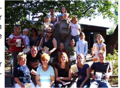
Die Teilnehmer nach der „Siegerehrung“