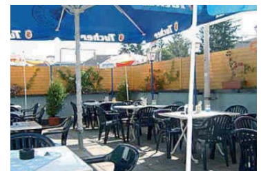
Die Terrasse der Waldschänke bei bestem Wetter