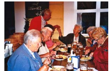
Mittagessen im Tegernseer „Hofbräuhaus“