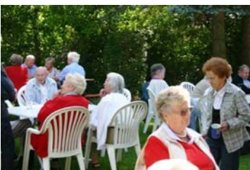
Das Wetter spielte auch schon im Juni mit

Am Samstag dem 19. September wurde im Jugendheim Mimberg unser letztes Grillfest für dieses Jahr durchgeführt.