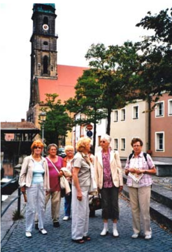
Unterwegs in der Altstadt von Amberg

Am 26 August waren acht Damen und ein Herr der uns begleitete, mit dem Zug nach Amberg gefahren. Unser Ziel war die Altstadt von Amberg zu erkunden.