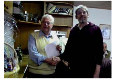
Gratulation zum 1. Platz