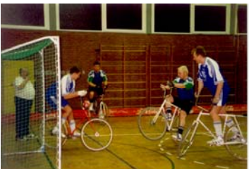
Radball in der Schloßleinsgasse

Am 27. Februar fand in der Schulturnhalle Schloßleinsgasse in Nürnberg-Reichelsdorf das Viertelfinale der Gruppe 4, das wir als Ausrichter übernommen hatten statt. Leider waren durch Krankheit nicht alle Mannschaften am Start, sodass wir nur mit vier Mannschaften das Turnier durchführen mussten. Platzierung: