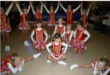
Die Kindergarde der Eibanesen

Am 07.02.2010 hat die Solidarität Reichelsdorf zum Kinderfasching eingeladen. Diese Einladung hatten sehr viele Kinder angenommen. Eine Gruppe aus Katzwang hatte gleich den Nebenraum (Jugendzimmer) für sich beansprucht.