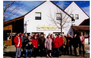
Vor dem „Rezatgrund“