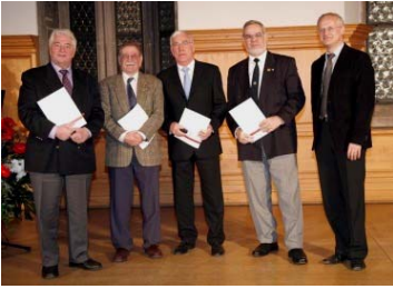
Die geehrten Funktionäre