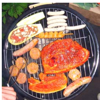
Ist das nicht lecker?

Unser letztes Grillfest, zu dem am 18. September 2010 eingeladen wurde, war nicht so gut besucht wie erwartet. Das lag zum Großteil am Regen. Das schlechte Wetter die Tage zuvor hatte Vielen die Lust aufs Grillen in der freien Natur verdorben. Doch es gab auch einige Unerschrockene, die es sich auch bei schlechtem Wetter nicht nehmen haben lassen, unserem Sportheim in Mimberg einen Besuch abzustatten. Die schöne Umgebung lädt trotz allem zum Spazieren gehen ein. Die Gäste und Mitglieder genossen dann auch am Nachmittag in unserem gemütlichen Aufenthaltsraum den Kaffee und ließen sich die leckeren Kuchen schmecken. Es gab viel zu Erzählen. Der Nachmittag war dann auch ruckzuck vorbei und gegen 17:00 Uhr wurde dann der Grill angeheizt.