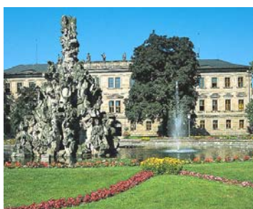
Der Schlossgarten Erlangen

Unser Ausflug führte uns dieses Jahr in einen Ort der Metropol-Region, nämlich nach Erlangen.